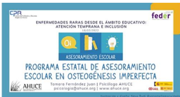
Curso "EE.RR. desde el ámbito educativo: atención temprana e inclusión" del Centro de Profesorado y Recursos de la Región de Murcia