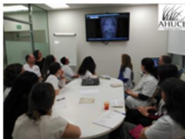
Participación de la psicóloga de AHUCE en las sesiones clínicas de la unidad de OI del Hospital Sant Joan de Deu (Barcelona)