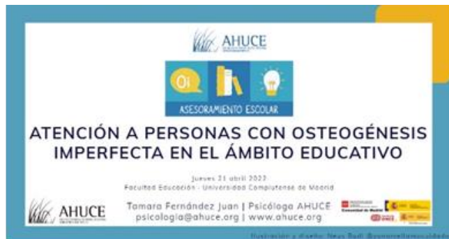
Facultad de Educación de la Universidad Complutense de Madrid